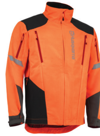
BRUSHCUTTING AND TRIMMER JACKET, TECHNICAL 597 66 02-46