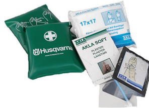
KIT PREMIER SECOURS 504 09 53-01