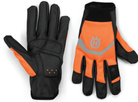
GLOVES, FUNCTIONAL LIGHT NON-SLIP 529 88 02-07