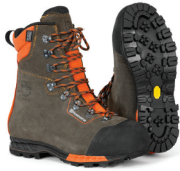
PROTECTIVE LEATHER BOOTS WITH SAW PROTECTION, FUNCTIONAL 24 597 65 93-38