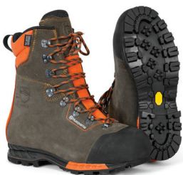
PROTECTIVE LEATHER BOOTS WITH SAW PROTECTION, FUNCTIONAL 24 597 65 93-43