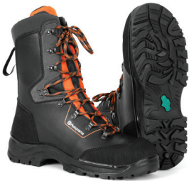
PROTECTIVE LEATHER BOOTS WITH SAW PROTECTION, CLASSIC 597 65 94-40