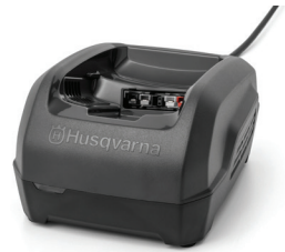
HUSQVARNA CHARGER QC250 967 97 01-02