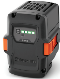
HUSQVARNA 40-B140 970 45 72-01