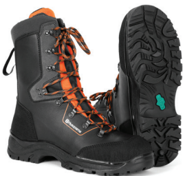
PROTECTIVE LEATHER BOOTS WITH SAW PROTECTION, CLASSIC 597 65 94-44