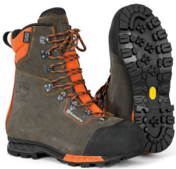
PROTECTIVE LEATHER BOOTS WITH SAW PROTECTION, FUNCTIONAL 24 597 65 93-39