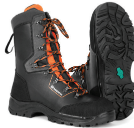
PROTECTIVE LEATHER BOOTS WITH SAW PROTECTION, CLASSIC 597 65 94-42