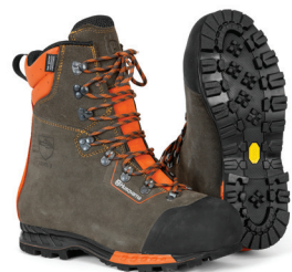
PROTECTIVE LEATHER BOOTS WITH SAW PROTECTION, FUNCTIONAL 24 597 65 93-46