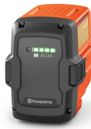
HUSQVARNA BATTERY BLI30 967 93 77-01