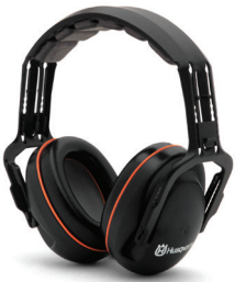
PROTECTEUR D'OREILLES, SERRE-TÊTE 505 66 53-04