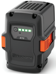
HUSQVARNA 40-B70 970 45 71-01