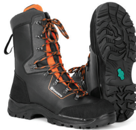
PROTECTIVE LEATHER BOOTS WITH SAW PROTECTION, CLASSIC 597 65 94-41