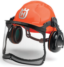
CASQUE FORESTIER, CLASSIC 580 75 43-01