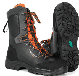
PROTECTIVE LEATHER BOOTS WITH SAW PROTECTION, CLASSIC 597 65 94-46