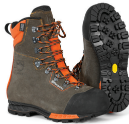
PROTECTIVE LEATHER BOOTS WITH SAW PROTECTION, FUNCTIONAL 24 597 65 93-41