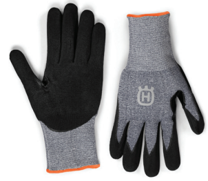
GLOVES, TECHNICAL GRIP 529 88 03-07