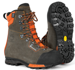
PROTECTIVE LEATHER BOOTS WITH SAW PROTECTION, FUNCTIONAL 24 597 65 93-42