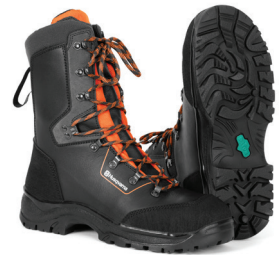
PROTECTIVE LEATHER BOOTS WITH SAW PROTECTION, CLASSIC 597 65 94-39