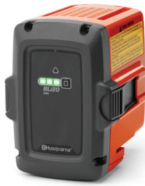
HUSQVARNA BATTERY BLI20 967 09 17-01