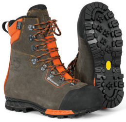
PROTECTIVE LEATHER BOOTS WITH SAW PROTECTION, FUNCTIONAL 24 597 65 93-47