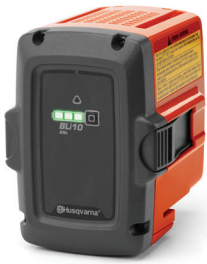
HUSQVARNA BATTERY BLI10 967 09 16-01