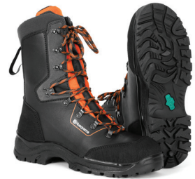
PROTECTIVE LEATHER BOOTS WITH SAW PROTECTION, CLASSIC 597 65 94-43