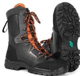
PROTECTIVE LEATHER BOOTS WITH SAW PROTECTION, CLASSIC 597 65 94-45