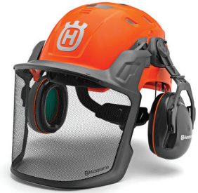
CASQUE FORESTIER, TECHNICAL 585 05 84-01