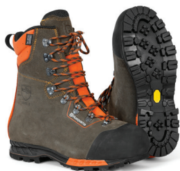
PROTECTIVE LEATHER BOOTS WITH SAW PROTECTION, FUNCTIONAL 24 597 65 93-44