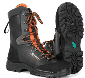
PROTECTIVE LEATHER BOOTS WITH SAW PROTECTION, CLASSIC 597 65 94-47