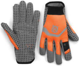
GLOVES, FUNCTIONAL LIGHT VENT 529 88 01-07