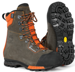
PROTECTIVE LEATHER BOOTS WITH SAW PROTECTION, FUNCTIONAL 24 597 65 93-40