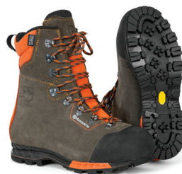
PROTECTIVE LEATHER BOOTS WITH SAW PROTECTION, FUNCTIONAL 24 597 65 93-45