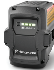
HUSQVARNA BATTERY BLI200X 970 44 89-01