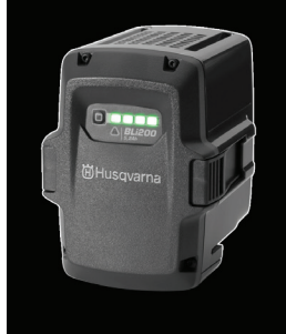
HUSQVARNA BATTERY BLI200 967 09 19-01