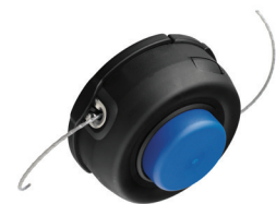
TÊTE NYLON SEMI AUTOMATIQUE T35 578 44 63-01