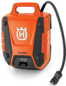
HUSQVARNA BLI950X 579 82 22-01