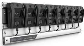
HUSQVARNA 40-C80 CHARGING STATION 970 62 19-01