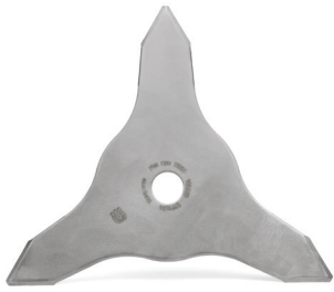
COUPEAU Á HERBE, 3 DENTS 578 44 49-01