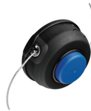
TÊTE NYLON SEMI AUTOMATIQUE T25 578 44 61-01