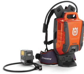
HUSQVARNA BLI950X 967 09 32-01