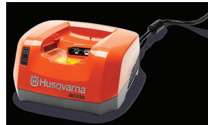
CHARGEUR POUR BATTERIES HUSQVARNA 970 52 22-01