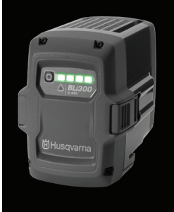
HUSQVARNA BATTERY BLI300 967 07 19-01