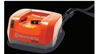
HUSQVARNA CHARGEUR QC500 970 44 95-01