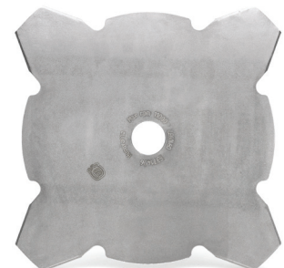
LAME À HERBE, 4 DENTS 578 44 37-01