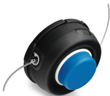
T35X TAP ADVANCE (BALL BEARING) 578 44 65-01