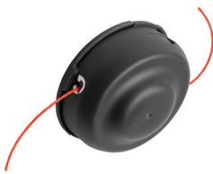
TRIMMER HEAD ERGO FEED 594 72 70-03