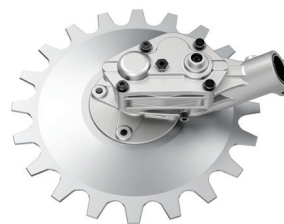
HUSQVARNA WEED SCISSOR GEAR ATTACHMENT RA-V 967 90 86-01