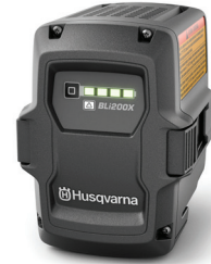
HUSQVARNA BATTERY BLI200X 970 44 89-02