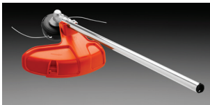
ACCESSOIRE TURBOFIL HUSQVARNA 537 35 35-01