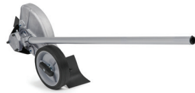
HUSQVARNA EDGER ATTACHMENT ESA850 967 92 56-04