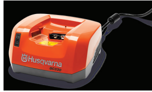
CHARGEUR POUR BATTERIES HUSQVARNA 970 52 22-01