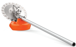
HUSQVARNA WEED SCISSOR ATTACHMENT RA850 967 90 85-01