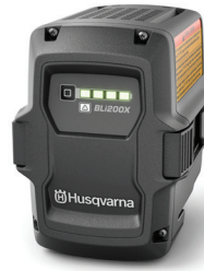
HUSQVARNA BATTERY BLI200X 970 44 89-01