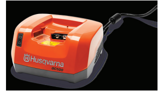
HUSQVARNA CHARGER QC500 970 44 95-01