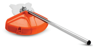
HUSQVARNA BCA 850/24 967 18 59-02