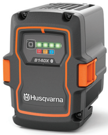
HUSQVARNA 40-B140X 970 60 79-01