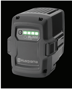
HUSQVARNA BATTERY BLI300 967 07 19-01