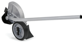
HUSQVARNA EDGER ATTACHMENT ECA850 967 92 55-04