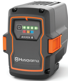
HUSQVARNA 40-B330X 970 60 77-01