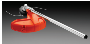
ACCESSOIRE COUPE-HERBE HUSQVARNA 537 35 35-03