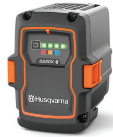
HUSQVARNA 40-B220X 970 60 78-01