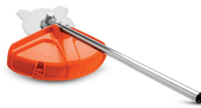
HUSQVARNA BCA 850/24 967 18 59-01