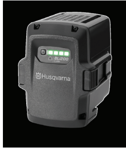
HUSQVARNA BATTERY BLI200 967 09 19-01