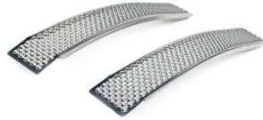
TRO050 - RAMPE DE CHARGEMENT 505 69 90-43