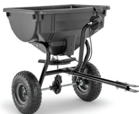
EPANDEUR 589 40 93-01