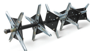
HUSQVARNA PLUG AERATOR 588 21 27-01