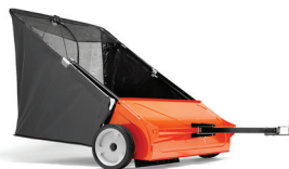
SWEEPER 586 63 65-01