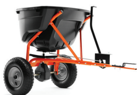
EPANDEUR 967 02 72-01