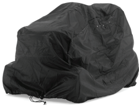
HOUSSE POUR TRACTEUR 505 63 08-82