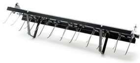
DETHATCHER 586 63 68-01