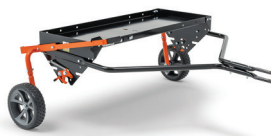
ATTACHMENT PLATFORM 586 63 72-01