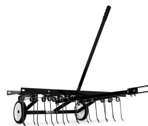
EMOUSSEUSE 586 63 66-01