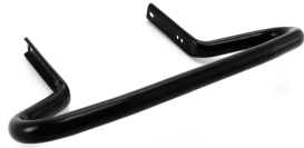
PARE-CHOCS. 954 12 00-49