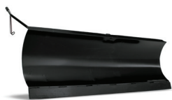
TRO038 - LAME À NEIGE FRONTALE 122CM 544 92 17-01