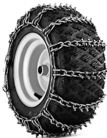
TRO036 - CHAÎNES À NEIGE AVEC CONTREPOIDS GT/YT/LT DES POINTES SOUDÉES 997 10 31-10