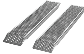
RAMPES DE CHARGEMENT 505 69 90-40