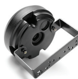
TRACTOR BRUSH GUARD. 505 56 88-13