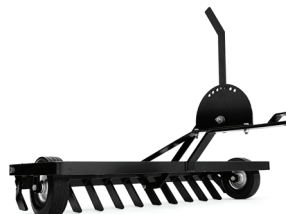
GRAVEL HARROW 953 51 24-01