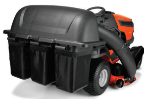
COLLECTOR 960 73 00-37