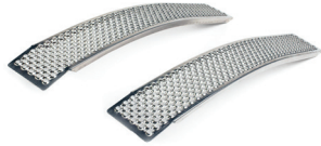
TRO049 - RAMPE DE CHARGEMENT 505 69 90-41