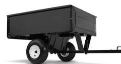
TRAILER 967 02 71-01