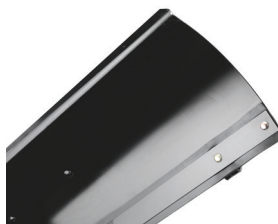
TRO059 - RACLETTE EN CAOUTCHOUC 966 00 19-01