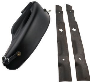
TRO044 - KIT DE BROYAGE 960 71 00-19