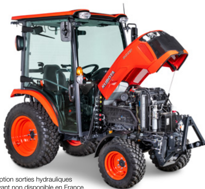
Option sorties hydrauliques avant non disponible en France.

Les moteurs diesel 3 cylindres coupleux de Kubota fournissent la puissance nécessaire pour les applications exigeantes et offrent une bonne traction pour les travaux de transport. Leur efficacité et leur fonctionnement agréablement plus silencieux sont des atouts supplémentaires convaincants.