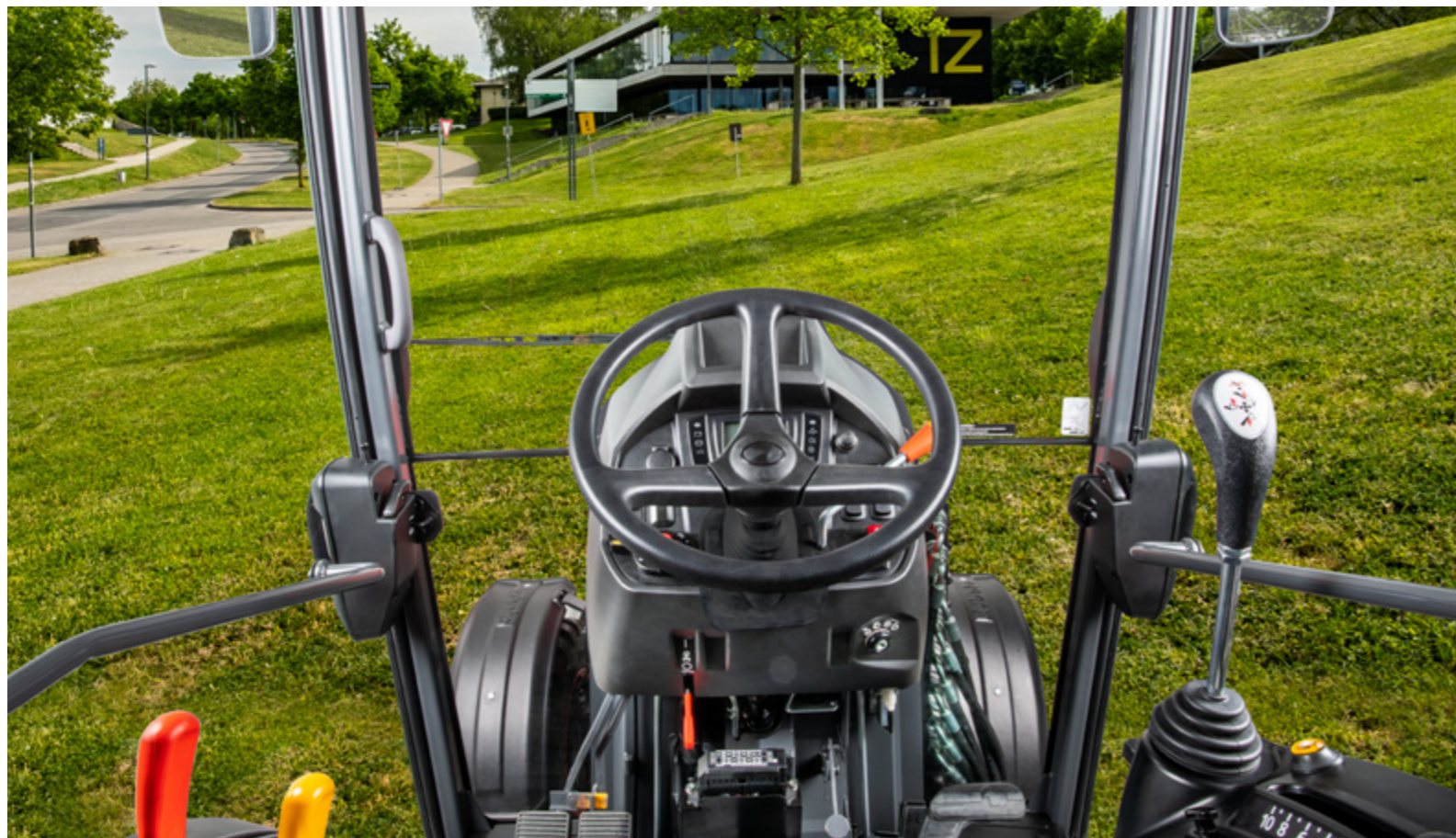
Mono-levier en option.