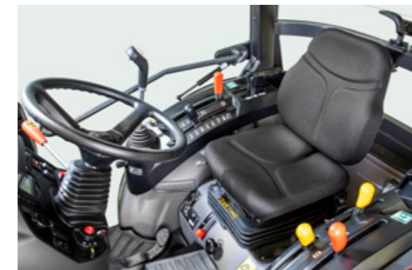
Mono-levier en option.

Le confort est-il important pour vous ? La climatisation de série, l'éclairage intérieur harmonisé et le chauffage de la vitre arrière contribuent au confort exceptionnel de la cabine et permettent de travailler sans fatigue, en toute sécurité et de manière productive. Pour encore plus de confort, un siège conducteur à suspension pneumatique et un essuie-glace arrière sont disponibles en option. La cabine est également équipée pour accueillir une radio (haut-parleur et antenne).