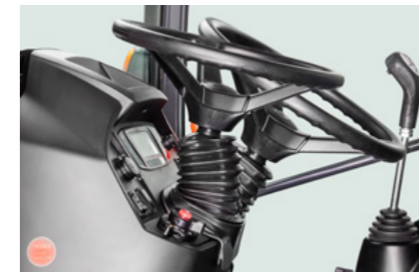
Mono-levier en option.