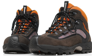
BOTTES DE PROTECTION TECHNICAL 575 35 47-43