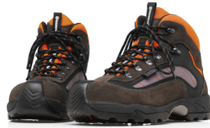
BOTTES DE PROTECTION TECHNICAL 596 30 64-43