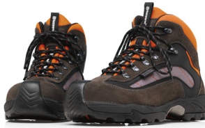
BOTTES DE PROTECTION TECHNICAL 575 35 47-37