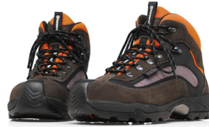
BOTTES DE PROTECTION TECHNICAL 596 30 64-40