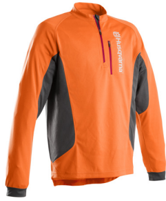
WORK T-SHIRT LONG SLEEVE, TECHNICAL 501 72 03-46