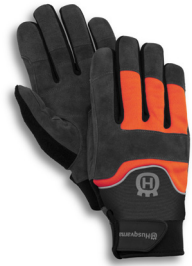
GANTS, TECHNICAL LIGHT 596 30 92-08