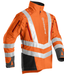
BRUSHCUTTING- AND TRIMMER JACKET, HIGH VIZ 597 24 59-58