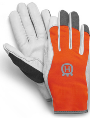
GANTS, CLASSIC LIGHT 596 31 06-09