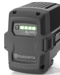
HUSQVARNA BATTERY BLI300 967 07 19-01