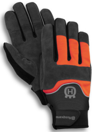
GANTS, TECHNICAL LIGHT 596 30 92-09