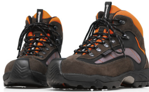
BOTTES DE PROTECTION TECHNICAL 575 35 47-44