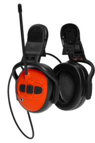
PROTECTION OREILLES AVEC RADIO FM 578 27 49-04