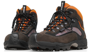
BOTTES DE PROTECTION TECHNICAL 575 35 47-45