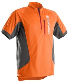
WORK T-SHIRT SHORT SLEEVE, TECHNICAL 501 71 59-50