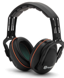
PROTECTEUR D'OREILLES, SERRE-TÊTE 505 66 53-04