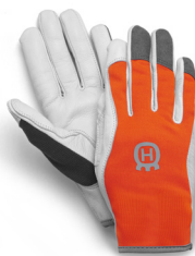
GANTS, CLASSIC LIGHT 579 38 00-09