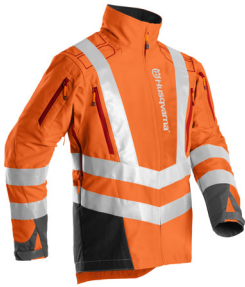
BRUSHCUTTING- AND TRIMMER JACKET, HIGH VIZ 597 24 59-62