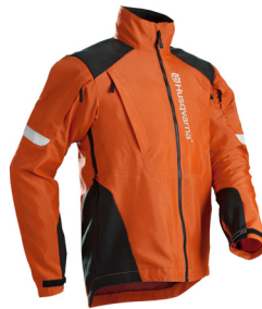
VESTE POUR TURBOFILS ET DÉBROUSSAILLEUSES, TECHNICAL 580 68 82-50