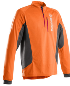
WORK T-SHIRT LONG SLEEVE, TECHNICAL 501 72 03-50