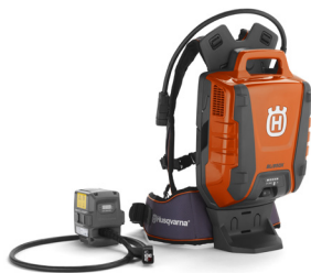
HUSQVARNA BATTERY BLI950X 967 09 32-01