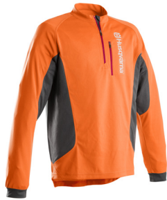
WORK T-SHIRT LONG SLEEVE, TECHNICAL 501 72 03-62