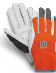
GANTS, CLASSIC LIGHT 596 31 06-06