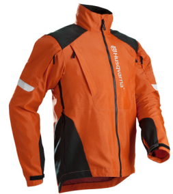
VESTE POUR TURBOFILS ET DÉBROUSSAILLEUSES, TECHNICAL 580 68 82-62