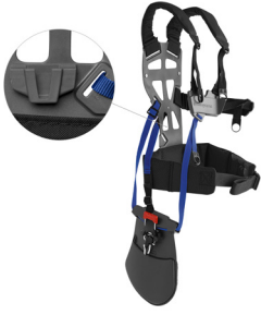
HARNES BALANCE XB 597 46 93-01