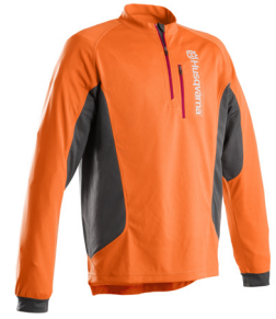
WORK T-SHIRT LONG SLEEVE, TECHNICAL 501 72 03-54