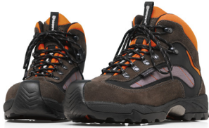
BOTTES DE PROTECTION TECHNICAL 596 30 64-38