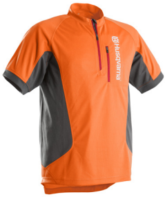
WORK T-SHIRT SHORT SLEEVE, TECHNICAL 501 71 59-66