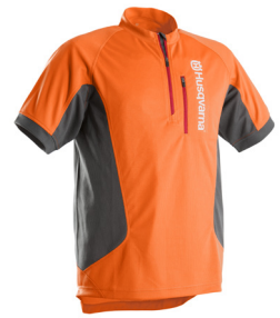
WORK T-SHIRT SHORT SLEEVE, TECHNICAL 501 71 59-62