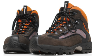
BOTTES DE PROTECTION TECHNICAL 596 30 64-47