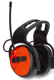
PROTECTION OREILLES AVEC RADIO FM 578 27 49-03