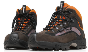
BOTTES DE PROTECTION TECHNICAL 575 35 47-41