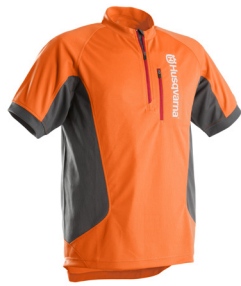
WORK T-SHIRT SHORT SLEEVE, TECHNICAL 501 71 59-54