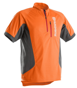
MODÈLE COURT TECHNICAL 501 71 59-46