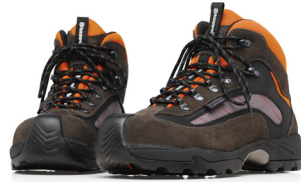
BOTTES DE PROTECTION TECHNICAL 596 30 64-39