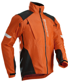
VESTE POUR TURBOFILS ET DÉBROUSSAILLEUSES, TECHNICAL 580 68 82-46