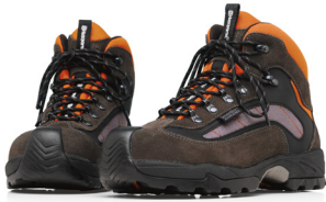
BOTTES DE PROTECTION TECHNICAL 596 30 64-42