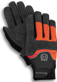
GANTS, TECHNICAL LIGHT 596 30 92-10