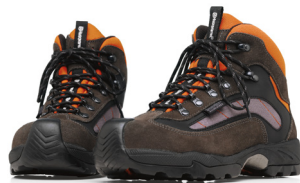
BOTTES DE PROTECTION TECHNICAL 575 35 47-47