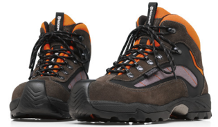
BOTTES DE PROTECTION TECHNICAL 596 30 64-45