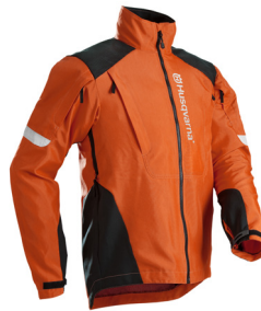
VESTE POUR TURBOFILS ET DÉBROUSSAILLEUSES, TECHNICAL 580 68 82-54