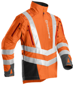
BRUSHCUTTING- AND TRIMMER JACKET, HIGH VIZ 597 24 59-46