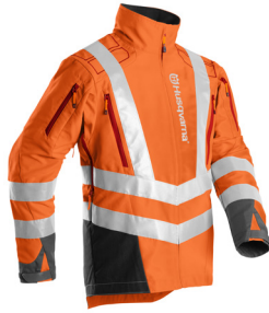
BRUSHCUTTING- AND TRIMMER JACKET, HIGH VIZ 597 24 59-50