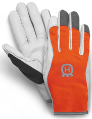
GANTS, CLASSIC LIGHT 596 31 06-08