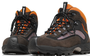
BOTTES DE PROTECTION TECHNICAL 596 30 64-36