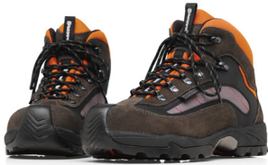
BOTTES DE PROTECTION TECHNICAL 575 35 47-42