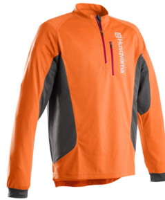
WORK T-SHIRT LONG SLEEVE, TECHNICAL 501 72 03-66