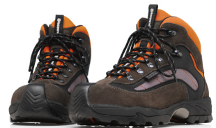
BOTTES DE PROTECTION TECHNICAL 596 30 64-37