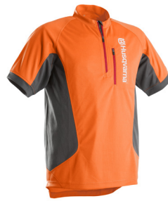
WORK T-SHIRT SHORT SLEEVE, TECHNICAL 501 71 59-58