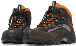
BOTTES DE PROTECTION TECHNICAL 596 30 64-46