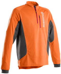
WORK T-SHIRT LONG SLEEVE, TECHNICAL 501 72 03-58