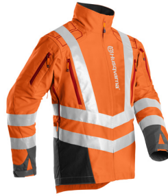
BRUSHCUTTING- AND TRIMMER JACKET, HIGH VIZ 597 24 59-54