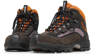
BOTTES DE PROTECTION TECHNICAL 596 30 64-41