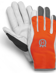
GANTS, CLASSIC LIGHT 596 31 06-10