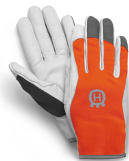
GANTS, CLASSIC LIGHT 596 31 06-07