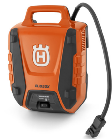
HUSQVARNA BATTERY BLI950X 579 82 22-01