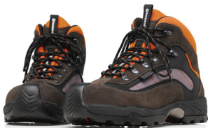
BOTTES DE PROTECTION TECHNICAL 575 35 47-46