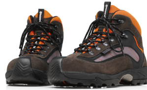
BOTTES DE PROTECTION TECHNICAL 596 30 64-44