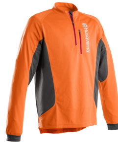
WORK T-SHIRT LONG SLEEVE, TECHNICAL 501 72 03-66