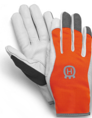
GANTS, CLASSIC LIGHT 596 31 06-07