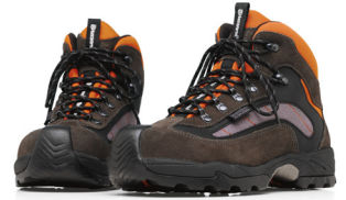
BOTTES DE PROTECTION TECHNICAL 596 30 64-42