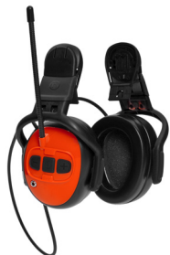
PROTECTION OREILLES AVEC RADIO FM 578 27 49-04