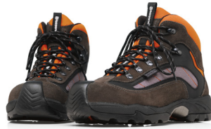
BOTTES DE PROTECTION TECHNICAL 596 30 64-44