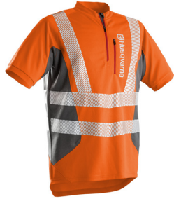
WORK T-SHIRT HIGH VIZ, TECHNICAL 501 72 05-66