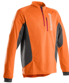
WORK T-SHIRT LONG SLEEVE, TECHNICAL 501 72 03-50