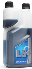
HUILE 2 TEMPS, LS+ 578 03 70-02