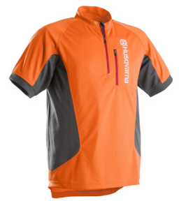
MODÈLE COURT TECHNICAL 501 71 59-46