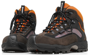
BOTTES DE PROTECTION TECHNICAL 596 30 64-43