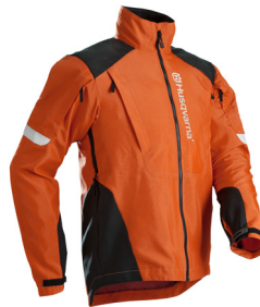
VESTE POUR TURBOFILS ET DÉBROUSSAILLEUSES, TECHNICAL 580 68 82-54