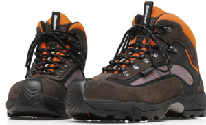
BOTTES DE PROTECTION TECHNICAL 596 30 64-40