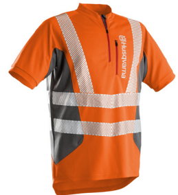
WORK T-SHIRT HIGH VIZ, TECHNICAL 596 30 39-66