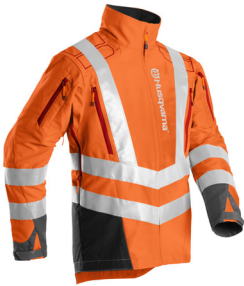
BRUSHCUTTING- AND TRIMMER JACKET, HIGH VIZ 597 24 59-62