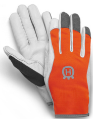
GANTS, CLASSIC LIGHT 579 38 00-09