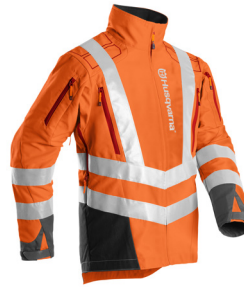
BRUSHCUTTING- AND TRIMMER JACKET, HIGH VIZ 597 24 59-54