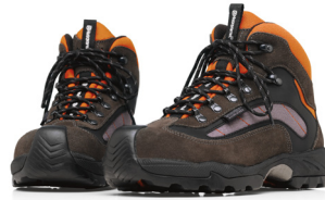
BOTTES DE PROTECTION TECHNICAL 596 30 64-45