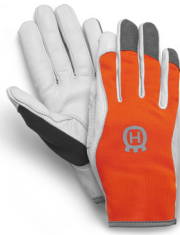
GANTS, CLASSIC LIGHT 596 31 06-10