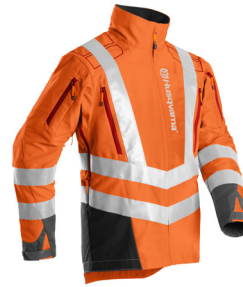
BRUSHCUTTING- AND TRIMMER JACKET, HIGH VIZ 597 24 59-58