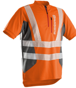
WORK T-SHIRT HIGH VIZ, TECHNICAL 501 72 05-54