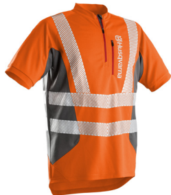
WORK T-SHIRT HIGH VIZ, TECHNICAL 596 30 39-58