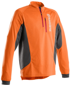
WORK T-SHIRT LONG SLEEVE, TECHNICAL 501 72 03-58