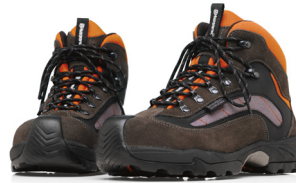
BOTTES DE PROTECTION TECHNICAL 575 35 47-45