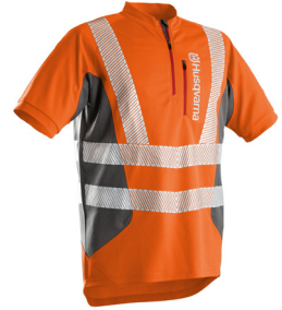
WORK T-SHIRT HIGH VIZ, TECHNICAL 501 72 05-58