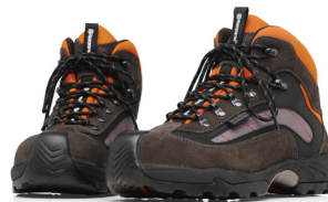
BOTTES DE PROTECTION TECHNICAL 596 30 64-37