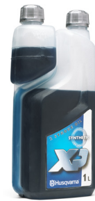
HUILE 2 TEMPS, XP® SYNTHETIC 578 03 70-03