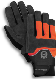
GANTS, TECHNICAL LIGHT 596 30 92-09