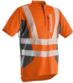
WORK T-SHIRT HIGH VIZ, TECHNICAL 501 72 05-46