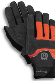
GANTS, TECHNICAL LIGHT 596 30 92-08