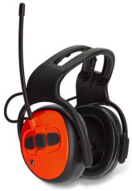
PROTECTION OREILLES AVEC RADIO FM 578 27 49-03