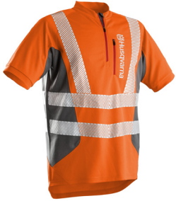
WORK T-SHIRT HIGH VIZ, TECHNICAL 501 72 05-62