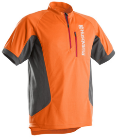
WORK T-SHIRT SHORT SLEEVE, TECHNICAL 501 71 59-66