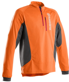
WORK T-SHIRT LONG SLEEVE, TECHNICAL 501 72 03-46