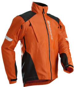
VESTE POUR TURBOFILS ET DÉBROUSSAILLEUSES, TECHNICAL 580 68 82-46