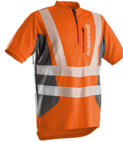
WORK T-SHIRT HIGH VIZ, TECHNICAL 596 30 39-46