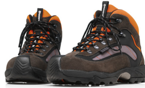
BOTTES DE PROTECTION TECHNICAL 596 30 64-41