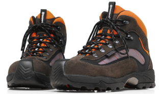
BOTTES DE PROTECTION TECHNICAL 596 30 64-46