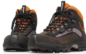
BOTTES DE PROTECTION TECHNICAL 575 35 47-41