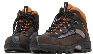
BOTTES DE PROTECTION TECHNICAL 596 30 64-38