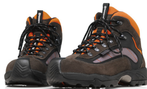
BOTTES DE PROTECTION TECHNICAL 596 30 64-36