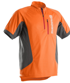
WORK T-SHIRT SHORT SLEEVE, TECHNICAL 501 71 59-58