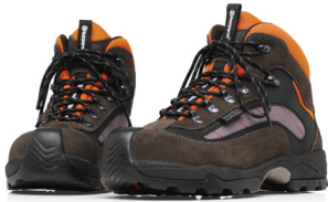
BOTTES DE PROTECTION TECHNICAL 575 35 47-43