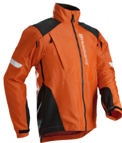
VESTE POUR TURBOFILS ET DÉBROUSSAILLEUSES, TECHNICAL 580 68 82-50