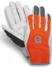
GANTS, CLASSIC LIGHT 596 31 06-09