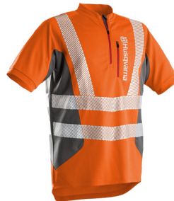
WORK T-SHIRT HIGH VIZ, TECHNICAL 596 30 39-62