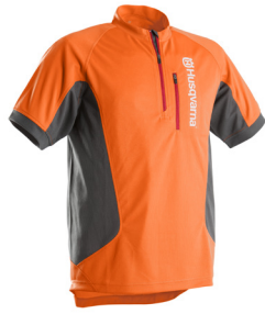
WORK T-SHIRT SHORT SLEEVE, TECHNICAL 501 71 59-54