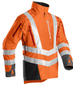
BRUSHCUTTING- AND TRIMMER JACKET, HIGH VIZ 597 24 59-50