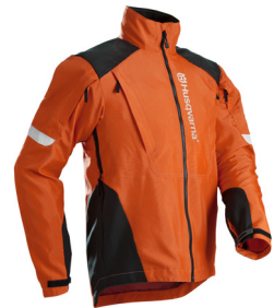
VESTE POUR TURBOFILS ET DÉBROUSSAILLEUSES, TECHNICAL 580 68 82-62