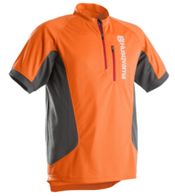
WORK T-SHIRT SHORT SLEEVE, TECHNICAL 501 71 59-62