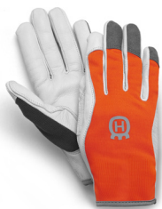
GANTS, CLASSIC LIGHT 596 31 06-06