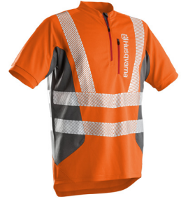
WORK T-SHIRT HIGH VIZ, TECHNICAL 596 30 39-50