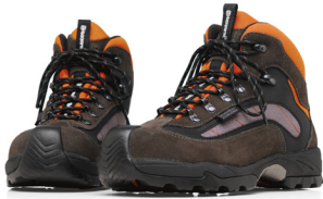
BOTTES DE PROTECTION TECHNICAL 596 30 64-47