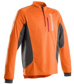
WORK T-SHIRT LONG SLEEVE, TECHNICAL 501 72 03-54