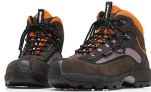
BOTTES DE PROTECTION TECHNICAL 575 35 47-44