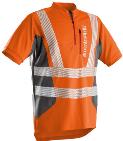
WORK T-SHIRT HIGH VIZ, TECHNICAL 596 30 39-54