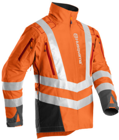
BRUSHCUTTING- AND TRIMMER JACKET, HIGH VIZ 597 24 59-46