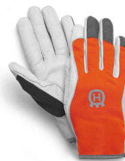
GANTS, CLASSIC LIGHT 596 31 06-08