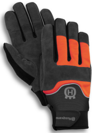
GANTS, TECHNICAL LIGHT 596 30 92-10