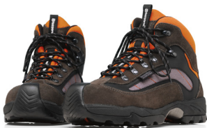
BOTTES DE PROTECTION TECHNICAL 575 35 47-47