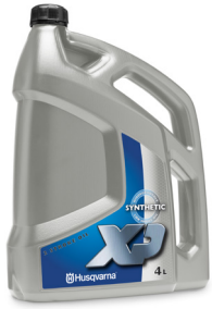
HUILE 2 TEMPS, XP® SYNTHETIC 578 03 71-03