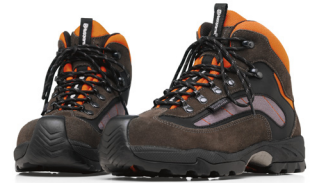
BOTTES DE PROTECTION TECHNICAL 575 35 47-46