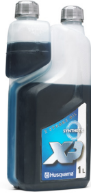
HUILE 2 TEMPS, XP® SYNTHETIC 578 18 00-03