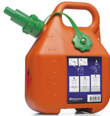
BIDON D'ESSENCE AVEC BEC VERSEUR ANTI-REFOULEMENT, 6 LITRES 505 69 80-01