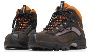
BOTTES DE PROTECTION TECHNICAL 575 35 47-42