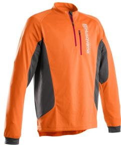
WORK T-SHIRT LONG SLEEVE, TECHNICAL 501 72 03-62