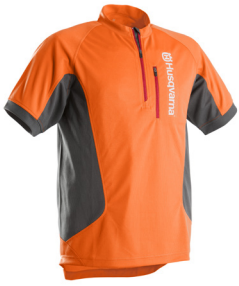
WORK T-SHIRT SHORT SLEEVE, TECHNICAL 501 71 59-50