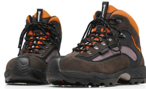
BOTTES DE PROTECTION TECHNICAL 575 35 47-37