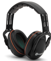
PROTECTEUR D'OREILLES, SERRE-TÊTE 505 66 53-04