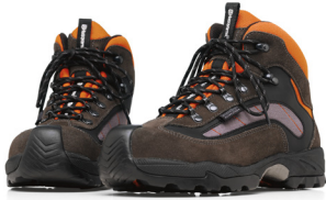
BOTTES DE PROTECTION TECHNICAL 596 30 64-39