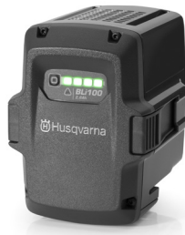
HUSQVARNA BATTERY BLI100 967 09 18-01