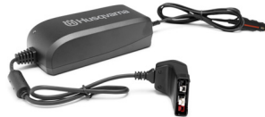
HUSQVARNA CHARGER QC500 967 09 15-01