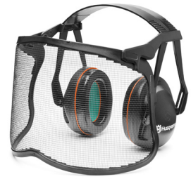
[AU] EARSMUFS WITH NET VISOR 505 66 53-61