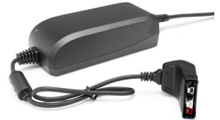
HUSQVARNA CHARGER QC80 967 33 56-31