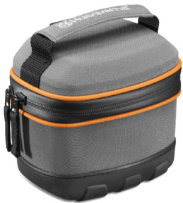
SAC POUR BATTERIE HUSQVARNA 585 37 18-01