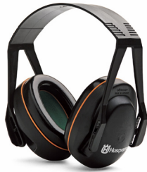
PROTÈGE-OREILLES GARDENER, CARTON DE 10 505 69 90-12