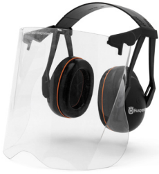
PROTÈGE-OREILLES AVEC VISIÈRE, GARDENER 505 66 53-60