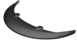
PROTECTION SOLAIRE POUR VISIÈRE 578 17 98-01