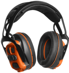
X-COM R 595 08 40-01