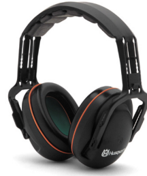
PROTECTEUR D'OREILLES, SERRE-TÊTE 505 66 53-04