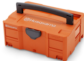
BOÎTE S POUR BATTERIE HUSQVARNA 585 42 87-01