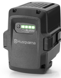
HUSQVARNA BATTERY BLI200 967 09 19-01