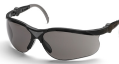
LUNETTES DE PROTECTION, PRO SOLAIRE 544 96 37-03