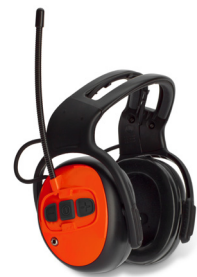
PROTECTION OREILLES AVEC RADIO FM 578 27 49-03