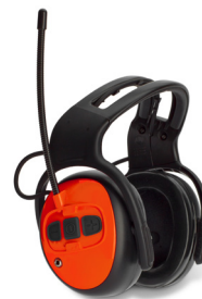
GEHOORBESCHERMER MET FM RADIO 578 27 49-03