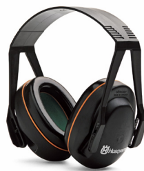
GEHOORBESCHERMING GARDENER PER 10 STUKS 505 69 90-12