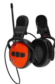
GEHOORBESCHERMER MET FM RADIO 578 27 49-04