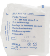
DRUKVERBAND 505 66 52-06