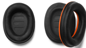
X-COM R HYGIEN KIT 596 48 94-01