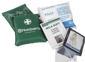
EHBO-SET 504 09 53-01