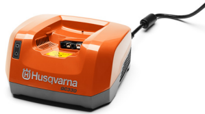
CHARGEUR POUR BATTERIES HUSQVARNA 967 09 14-01