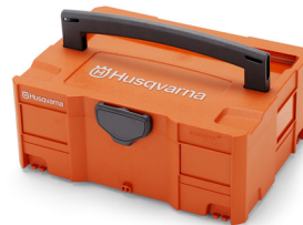
BOÎTE S POUR BATTERIE HUSQVARNA 585 42 87-01