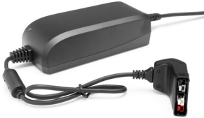
HUSQVARNA CHARGER QC80 967 33 56-31