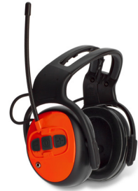
PROTECTION OREILLES AVEC RADIO FM 578 27 49-03