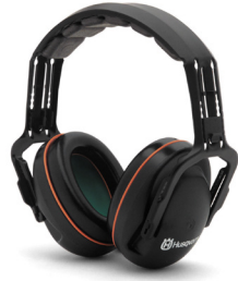
PROTECTEUR D'OREILLES, SERRE-TÊTE 505 66 53-04