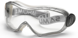
MASQUE DE PROTECTION 544 96 39-01