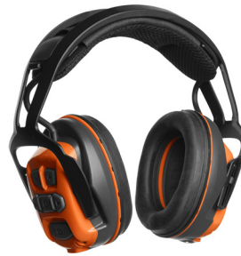
X-COM R 595 08 40-01