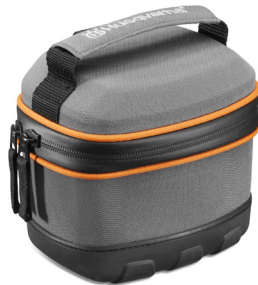
SAC POUR BATTERIE HUSQVARNA BOÎTE S POUR BATTERIE HUSQVARNA 585 37 18-01