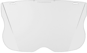
VISIÈRE EN PLEXIGLASS 505 66 53-43