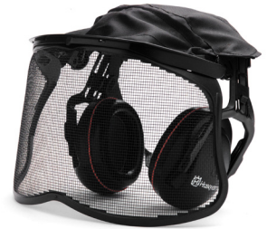
VISIÈRE GRILLAGÉE 505 66 53-58