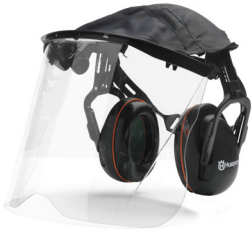
VISIÈRE PLEXIGLASS 505 66 53-48