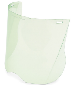
VISIÈRE ANTI-BUÉE 505 66 53-63