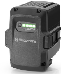
HUSQVARNA BATTERY BL1200 967 09 19-01