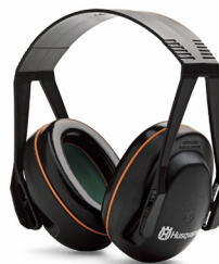
PROTÈGE-OREILLES GARDENER, CARTON DE 10 505 69 90-12