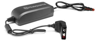
HUSQVARNA CHARGER QC80F 967 62 83-01