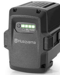
HUSQVARNA BATTERY BL100 967 09 18-01