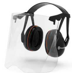
PROTÈGE-OREILLES AVEC VISIÈRE, GARDENER 505 66 53-60