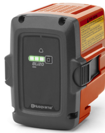
HUSQVARNA BATTERY BL120 967 09 17-01