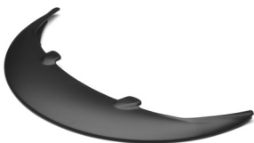
PROTECTION SOLAIRE POUR VISIÈRE 578 17 98-01