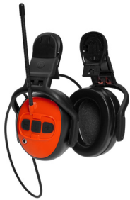
PROTECTION OREILLES AVEC RADIO FM 578 27 49-04