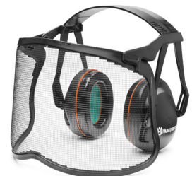
[AU] EARSMUFS WITH NET VISOR 505 66 53-61