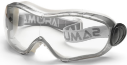
MASQUE DE PROTECTION 544 96 39-01