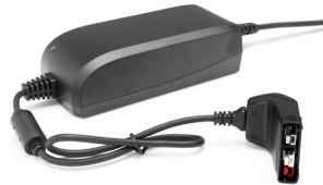
HUSQVARNA CHARGER QC80 967 33 56-31