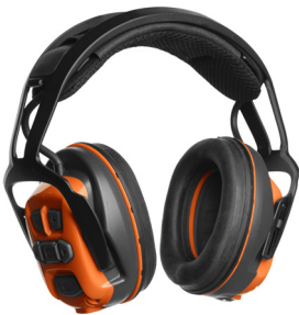
X-COM R 595 08 40-01