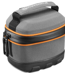
SAC POUR BATTERIE HUSQVARNA 585 37 18-01