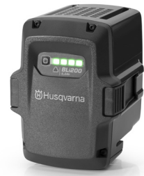
HUSQVARNA BATTERY BLI200 967 09 19-01