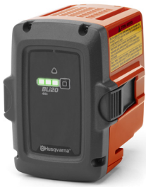
HUSQVARNA BATTERY BLI20 967 09 17-01