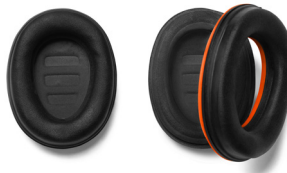
X-COM R HYGIEN KIT 596 48 94-01