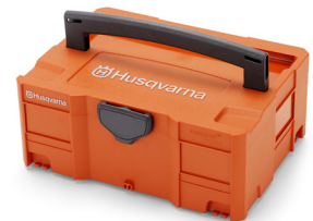
BOÎTE S POUR BATTERIE HUSQVARNA 585 42 87-01