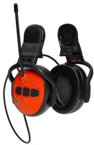
PROTECTION OREILLES AVEC RADIO FM 578 27 49-04