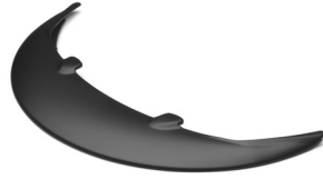
PROTECTION SOLAIRE POUR VISIÈRE 578 17 98-01