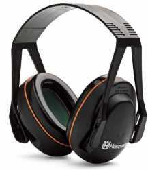
PROTÈGE-OREILLES GARDENER, CARTON DE 10 505 69 90-12