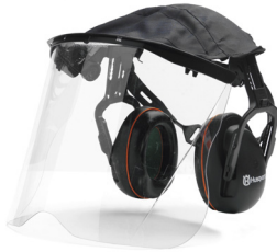
VISIÈRE PLEXIGLASS 505 66 53-48