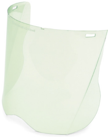
VISIÈRE ANTI-BUÉE 505 66 53-63