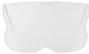
VISIÈRE EN PLEXIGLASS 505 66 53-43