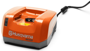
CHARGEUR POUR BATTERIES HUSQVARNA 967 09 14-01