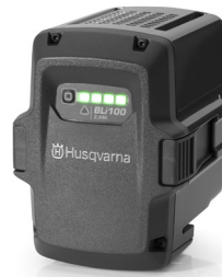
HUSQVARNA BATTERY BLI100 967 09 18-01