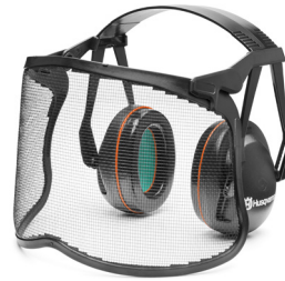
[AU] EARSMUFS WITH NET VISOR 505 66 53-61