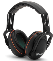
PROTECTEUR D'OREILLES, SERRE-TÊTE 505 66 53-04