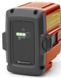
HUSQVARNA BATTERY BLI10 967 09 16-01