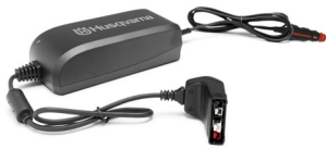
HUSQVARNA CHARGER QC80F 967 62 83-01