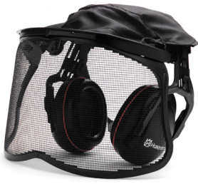
VISIÈRE GRILLAGÉE 505 66 53-58