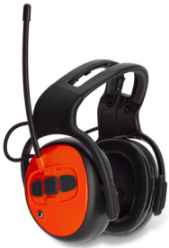
PROTECTION OREILLES AVEC RADIO FM 578 27 49-03