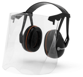
PROTÈGE-OREILLES AVEC VISIÈRE, GARDENER 505 66 53-60