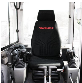
Siège ergonomique avec amortisseur