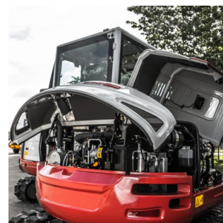
Accessibilité facile pour l'entretien