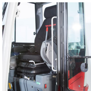
Console de commande rabattable